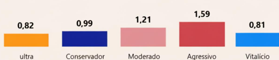
Plano B – Perfis de Investimento