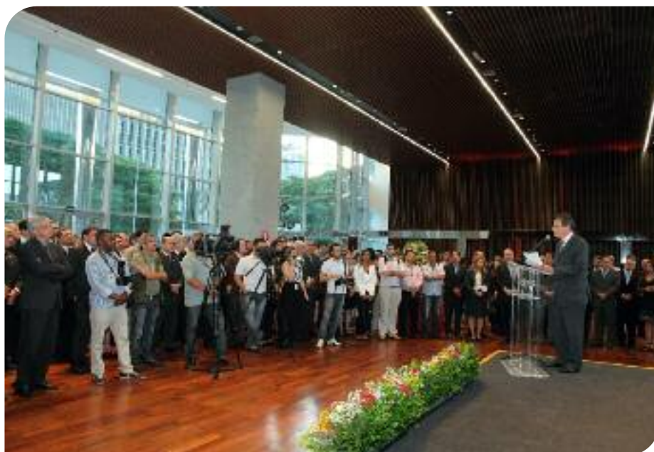
O hall de entrada, com cerca de 400 convidados, foi o local da cerimônia de inauguração